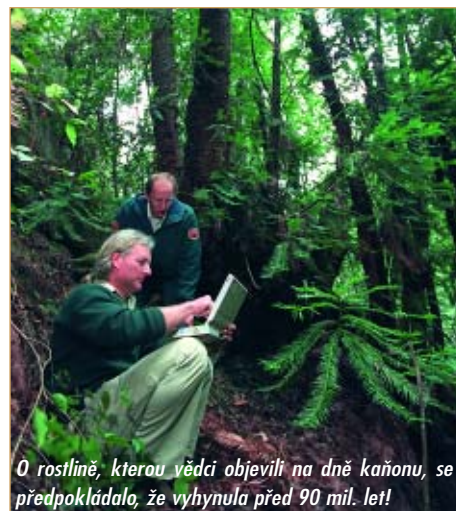
O rostlině, kterou vědci objevili na dně kaňonu, se předpokládalo, že vyhynula před 90 mil. let!

Použití: jedinečné sbírkové rostliny, pro muzea, botanické zahrady a národní parky.